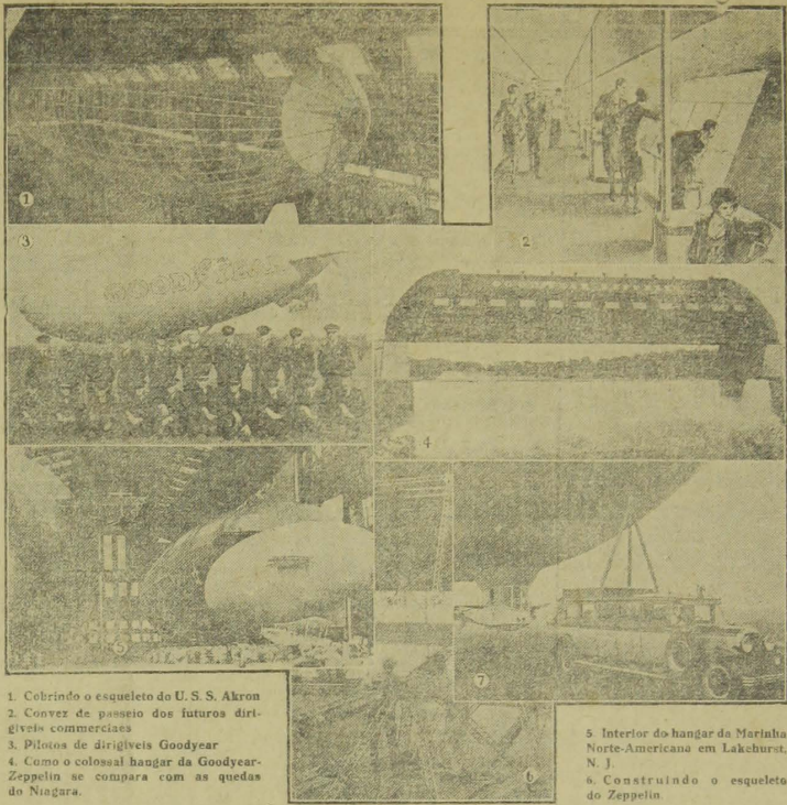
1. Cobrindo o esqueleto do U. S. S. Akron 2. Convex de passeio dos futuros dirigíveis commerciaes 3. Piloto de dirigíveis Goodyear 4. Como o colossal hangar da Goodyear-Zeppelin se compara com as quedas do Niagara. 5. Interior do hangar da Merinha Norte-Americana em Lakehurst, N. J. 6. Construindo o esqueleto do Zeppelin.

E, descerrando a significativa cortina que vela a querida effie do grande presidente desaparecido, o chefe desta reparação declara oficialmente apposto o retrato do immortal filho da Parahyba."